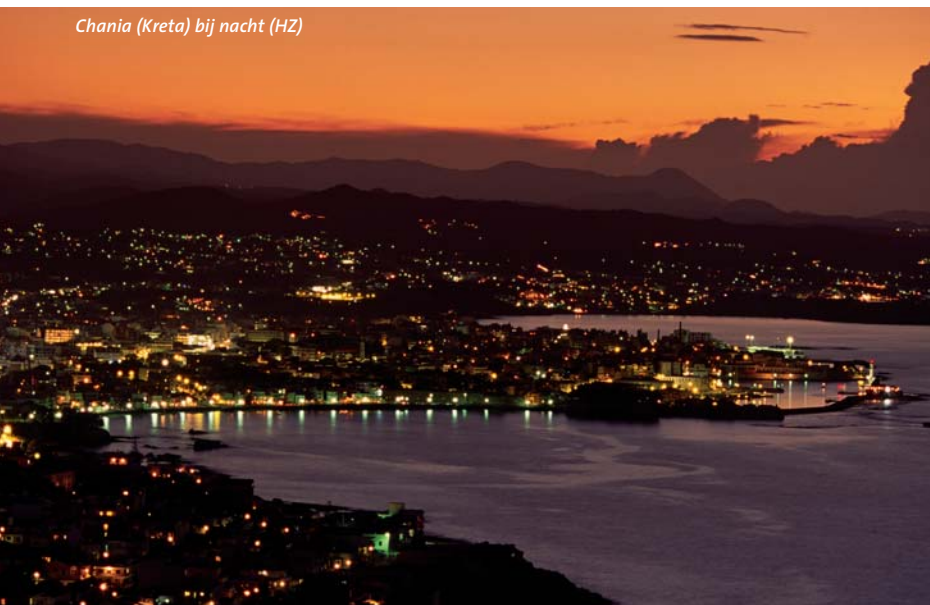
Chania (Kreta) bij nacht (HZ)