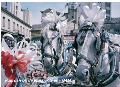
Paarden op de Plaka, Athene (MM)

Bijna de helft van Griekenland is bedekt met ontboste bergen. In het westen ligt langs de kust het Pindosgebergte; in het oosten steekt de Olympus (2911 m) boven het gebergte uit. Ook het zuidelijke schiereiland Peloponnesos en de talrijke eilanden in de Egeïsche Zee zijn bergachtig. Er heerst in het binnenland een Centraal-Europees klimaat en aan de kust en op de eilanden een Middellandse Zeeklimaat. Griekenland is een klassiek reisland. De opgravingen uit de oudheid en de stranden op de eilanden trekken jaarlijks miljoenen vakantiegangers.