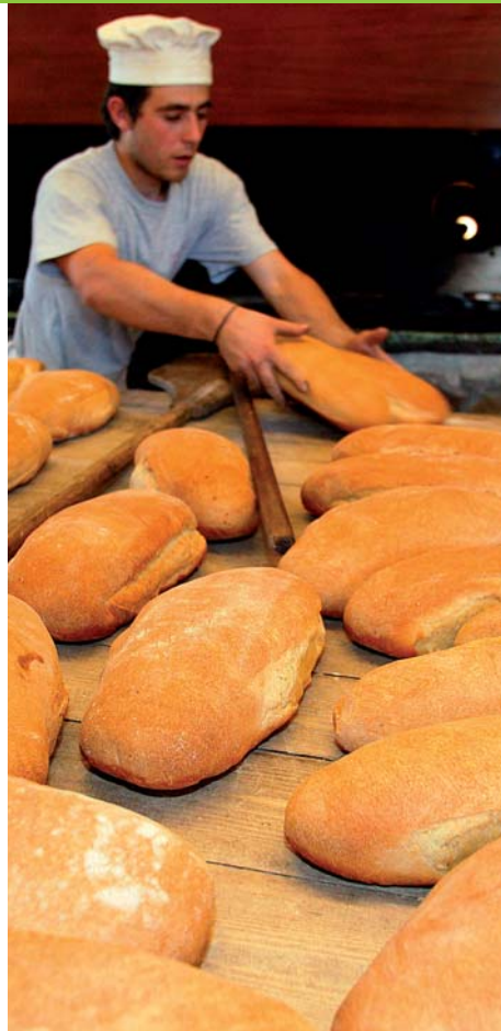
Bakkerij in Metsóvo (LD)

Afgezien van opstoppingen rond de grote Griekse steden tijdens de ochtend- en avondspits, valt het met de verkeers-